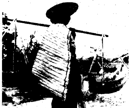
身披蓑扇的 阿昌族妇女

阿昌族 (Achang nationality) 中国的少数民族。(参见彩图插页第6页)史籍中称“峨昌”、“戛昌”、“俄昌”等。因居住地区不同，又有不同的自称和他称，如“勐撒掸”、“衬撒”、“汉撒”等。主要分布在云南省德宏傣族景颇族自治州的陇川、梁河等县，此外，也有少数分布在盈江、潞西、瑞丽及保山地区的龙陵和腾冲两县。人口为20441人(1982)。使用阿昌语，属汉藏语系藏缅语族缅语支，分为梁河、陇川、潞西3个方言。无文字，习用汉文和傣文。历史上与景颇、汉、傣、白等族关系密切。