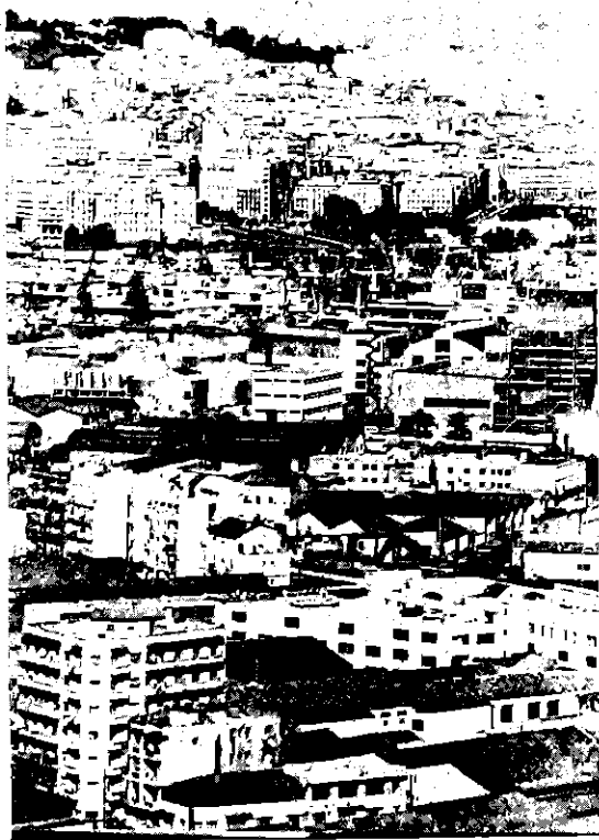
阿尔及尔港口景色

主张突厥、蒙古、满-通古斯3个语族有共同来源的主要根据是粘着法上的一致性。阿尔泰语系语言都是粘着语,词的派生和词的语法变化都以添加粘附成分为主要手段。3个语族之间表示某种语法范畴的粘附成分有